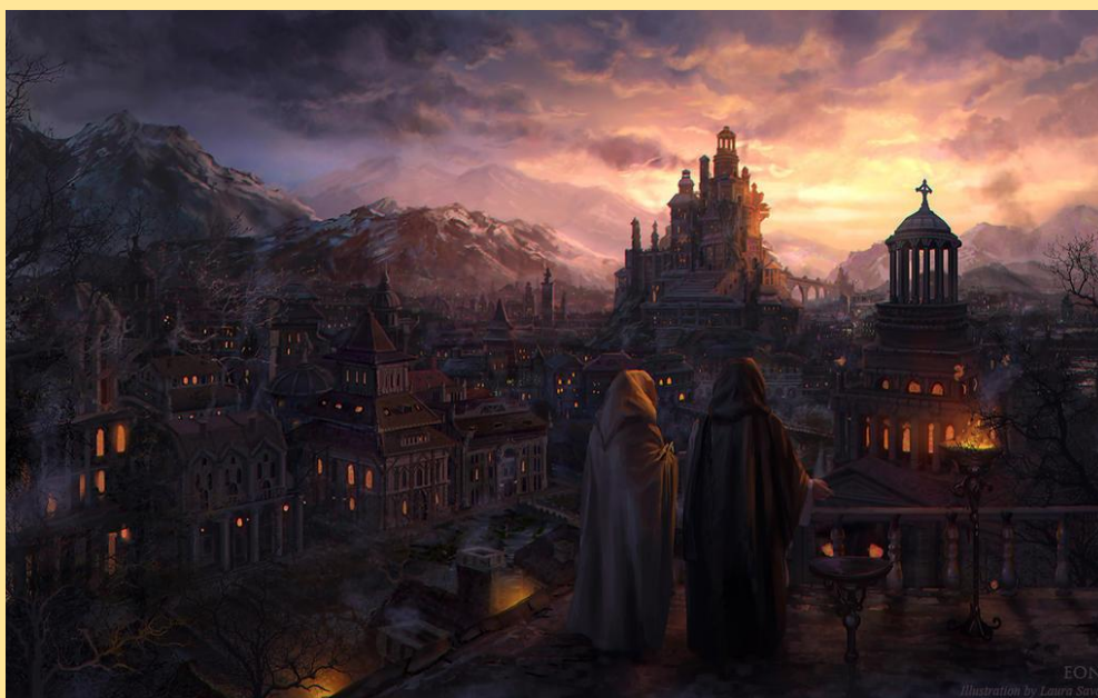
Współczesne wyobrażenie Klume w czasach rozkwitu

Oczywiście nie. W XII w. Klume pojawia się pod Czarnym Lasem, za wschód od Gór Orlich. Jest to niemalże drugi koniec wyspy Bialenii. Archiwa nowego miasta dość dobrze się zachowały i wskazują na dość rozwinięty już, jak na warunki epoki, system biurokracji. Co więcej, zachowała się nawet kronika miejska, ale nie ma w niej ani słowa na temat okoliczności, jak to się mówi, uuuu, zmiany miejsca zamieszkania. Czy po całkowitym wyparciu Aharów z wyspy ok. 1140 r. coś powstrzymywałoby mieszkańców miasta przed kultywowaniem pamięci opartej na martyrologii? A wreszcie, dlaczego nie zdecydowali się oni wrócić do starego miasta, skoro, jak odkrywają archeologowie, nie było ono aż tak zniszczone, by nie dało się go podnieść z ruin?