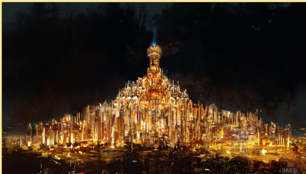
Artystyczna wizja Złotego Pałacu

Największą sławę miastu przyniósł Złoty Pałac. Ta w całości od zewnątrz pozłacana budowla doprowadziła do spustoszenia bialeńskiego skarbcza. Szacuje się, że do dziś budowla ta zwróciła się tylko w 30%, wliczając w to zyski z biletów do mieszczącego się tam obecnie muzeum narodowego.