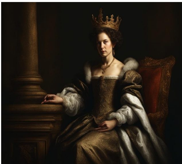
(Wilhelmina Akrytydka 1178-1254)

Ciuciad Real w 1046 roku. Miasto to wkrótce stało się stolicą nowopowstałego Królestwa Skarlandu, na którego tronie zasiadł najmłodszy z braci Piotra. Dziedzicem Piotra został jego syn Jakub I. W trakcie jego rządów nastąpił rozkwit państwa akrycko-walencckiego. Był związany przede wszystkim z odkryciem złóż soli. Dzięki eksportowi soli, kraj stał się mocarstwem Vaarlandu. Przez nieumiejętne rządy Jana III w latach 1080-1104 doszło do osłabienia i upadku gospodarczego. Doprowadził do wyniszczających wojen między Acri i Skarlandem, które trwały do połowy kolejnego stulecia. Wojny te doprowadziły do podziału państwa. Ponowne zjednoczenie państwa nastąpiło w roku 1202 roku, gdy Filip I pokonał samozwańczych władców. Po jego śmierci na tron wstąpił Filip II Impotent. Rządził on w latach 1206-1234. W wyniku zarażenia się chorobą weneryczną, pozostał bezpłodny. Jego śmierć ustanowiła wygaśnięcie dynastii Walencjuszy.