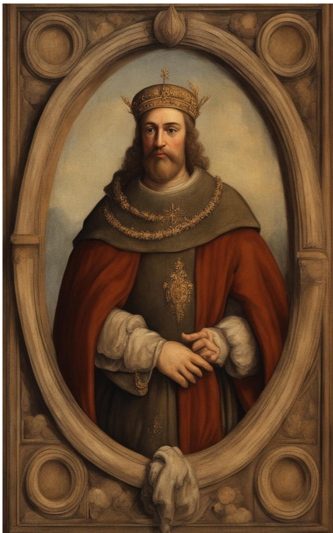
(Dorius II Pogromca)

wykorzystał brat Zenona – Jan, który w 607 roku wraz z wojskiem wkroczył do grodu w Acri. Po pozbawieniu życia Astasa, przejął stery władzy w państwie jako regent. Po śmierci brata w 608 roku przejął władzę. Jego panowanie przyczyniło się do sojuszu z Galicją. Przyczynił się do rozpoczęcia walk między Akrytami i Maurami. Nasiliły one wrogość między oboma państwami.