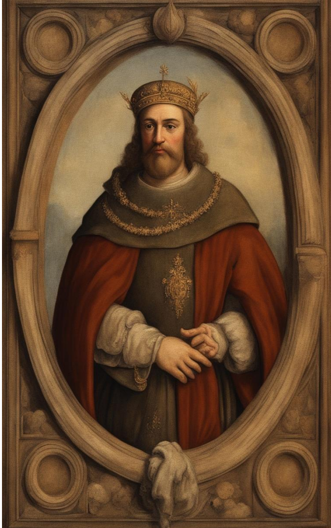
(Dorius II Pogromca)

wykorzystał brat Zenona – Jan, który w 607 roku wraz z wojskiem wkroczył do grodu w Acri. Po pozbawieniu życia Astasa, przejął stery władzy w państwie jako regent. Po śmierci brata w 608 roku przejął władzę. Jego panowanie przyczyniło się do sojuszu z Galicją. Przyczynił się do rozpoczęcia walk między Akrytami i Maurami. Nasiliły one wrogość między oboma państwami.