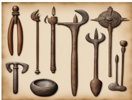
(Narzędzia z epoki żelaza)

Epoka brązu na Półwyspie skarlandzkim trwała od 1700–1300 r. P.n.e. Wywołała ona głębokie przemiany społeczne. Do rozpoczęcia przemian przyczynił się bezpośredni rozwój hutnictwa, który zaowocował wynalezieniem brązu będącego stopem miedzi i cyny. Około 1300 r. p.n.e. Na terenach obecnej wspólnoty Galicji i Leónu. Pojawiły się zespoły obronne castros. Na obszarze wspólnoty Móstoles powstały wtedy budowle zwane talayos.