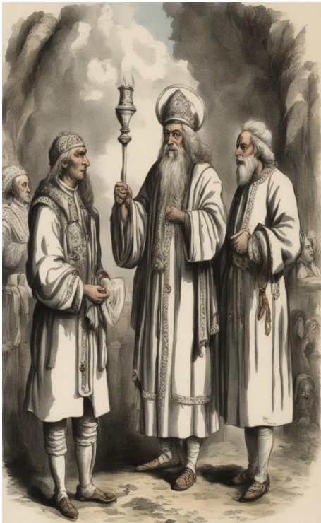
(Chrzest Abdona II 553 rok)

Początek osadnictwa akryckiego na tych ziemiach datuje się na początek X wieku p.n.e. Osiadły tu na skutek wędrówki plemion italijskich z obszarów południowej Polondii przez Francję przedostały się na południe kontynentu. Powstanie pierwszego państwa Akrytów na terenach Półwyspu skarlandzkiego datuje się na IX wiek p.n.e. Państwo powstało, gdy plemiona zamieszkujące tereny południowo-wschodniej Mesety, zjednoczyły się pod wpływem narastającego zagrożenia ze strony tubylczych ludów.