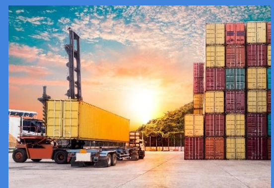
Podpis obrazu do reklamy.