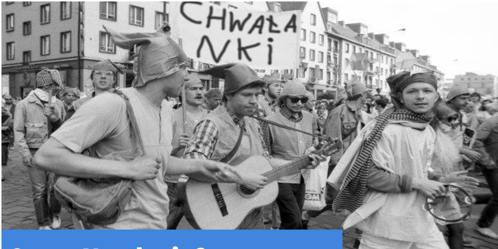
Manifestacja obywatelska w Achkovie, stolicy II FN