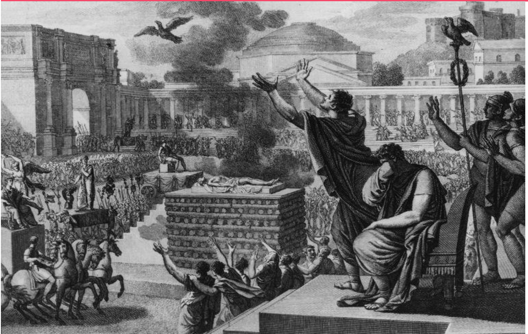
Uroczystości pogrzebowe Fenocji