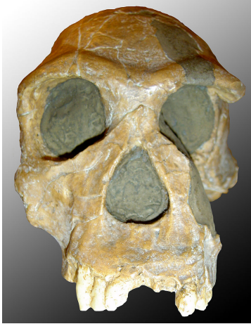
Oto czaszka micro habilis 'a

Proto-ludzie z tego prehistorycznego okresu żyli koczowniczym i zbierackim trybem życia. Wiemy, że gromadzili się w stada liczące od dziesięciu do nawet dwunastu osobników. Nierzadko jednak było to około pięciu homo habilisów .