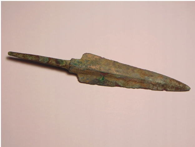
Żelazna grota pochodząca z ziem Batawii

Okres dziejów ludzkości następujący po epoce brązu, w której żelazo stało się głównym surowcem w wytwarzaniu narzędzi. Ramy czasowe epoki żelaza są różne i uzależnione od stref geograficznych, zróżnicowania kulturowego i rozwoju społeczno-gospodarczego. Pierwsze