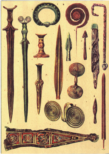
Ozdoby i ostrza z okresu epoki brązu prosto z Moreniki.